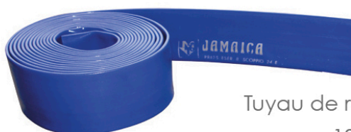
Tuyau de refoulement 10 m